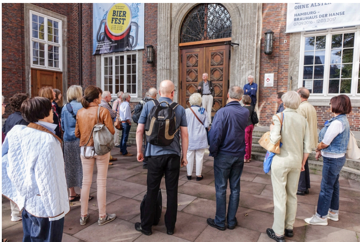
Studienkontakttag 2016, vor dem Museum für Hamburgische Geschichte

Höfken: Und entsprechend auch höhere Einnahmen. - Wir sind mit 17 Mitgliedern gestartet. Den Förderverein haben wir erst nachträglich gegründet. Ursprünglich hatten wir nur eine Interessenvertretung, die aber keine juristische Person war. Da haben sich 2004 ein paar Leute zusammengesetzt und haben gesagt, wir müssen ja eigentlich auch mal eine Stimme für die Älteren geltend machen. Da hat man dann einfach so per Zuruf eine Interessenvertretung, einen Sprecherrat gegründet. Das Verfahren, dass der Sprecherrat alle zwei Jahre gewählt wird, ist erst später entstanden, und zwar per Briefwahl, immer mit der Anmeldung zum Wintersemester. Alle zwei Jahre kann man den Sprecherrat wählen, das