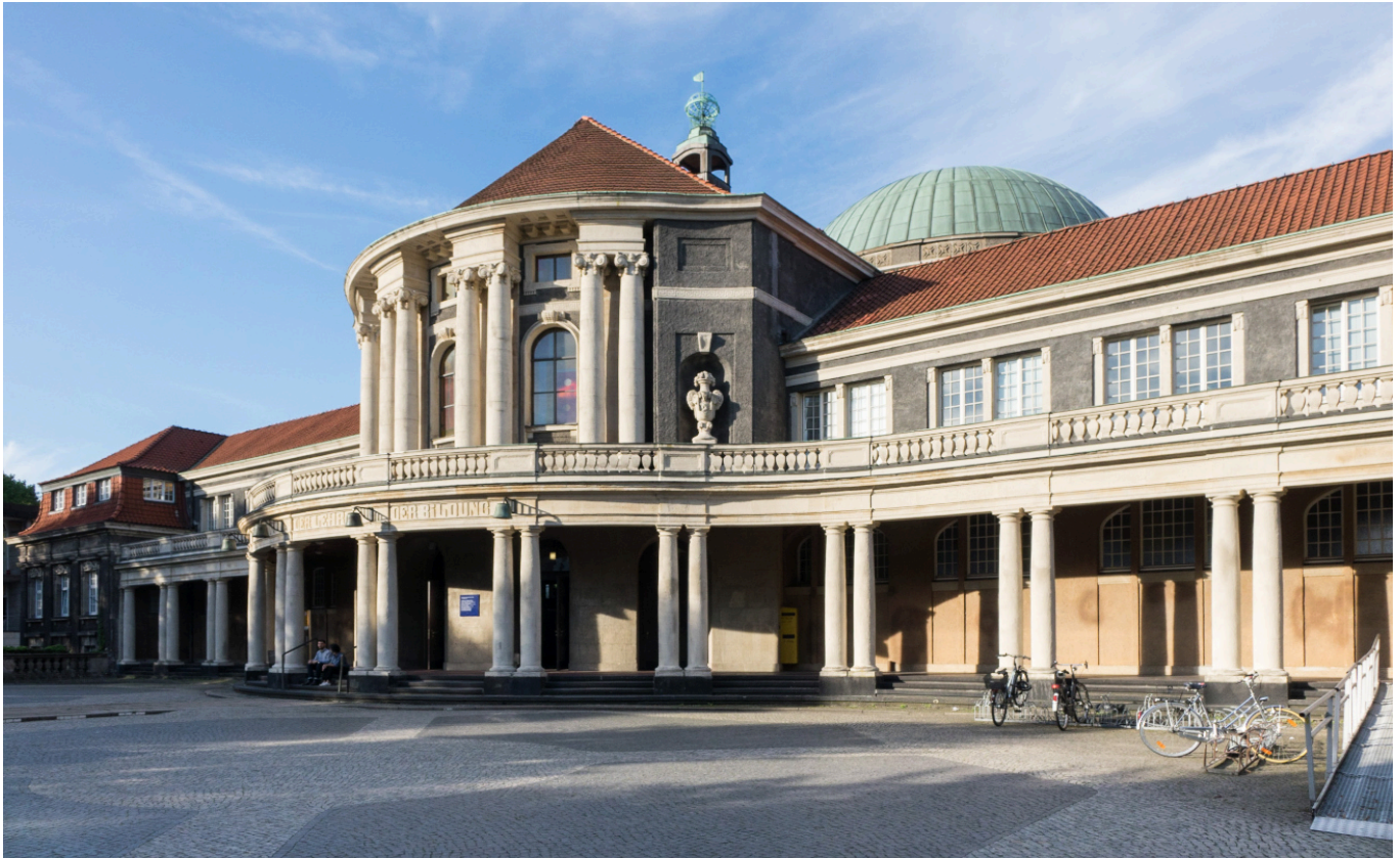
Universität Hamburg

Winter wieder bei 1.600 und im Sommer so bei 1.300. Also wir haben noch nicht den Stand vor Corona wieder erreicht, aber es wächst langsam wieder.