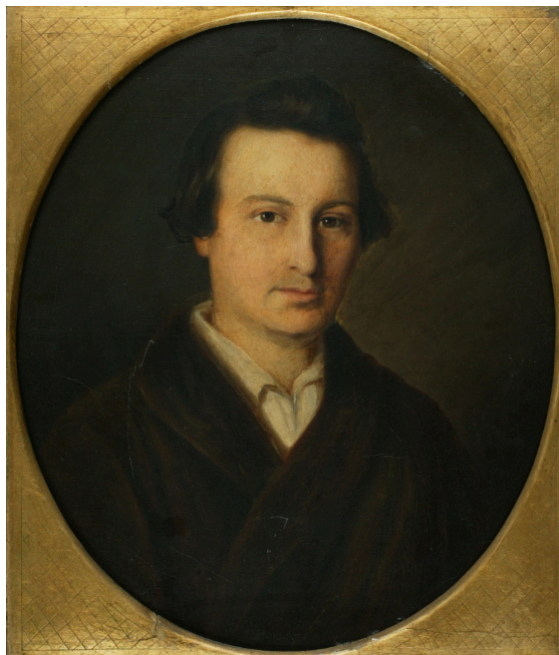
Heinrich Heine 1843*

„Ich schreibe diese Zeilen in den letzten Stunden des scheidenden bösen Jahres. Das neue steht vor der Türe. Möge es minder grausam sein als sein Vorgänger! Ich sende meinen wehmütigsten Glückwunsch zum Neujahr über den Rhein. Ich wünsche den Dummen ein bißchen Verstand und den Verständigen ein bißchen Poesie. Den Frauen wünsche ich die schönsten Kleider und den Männern sehr viel Geduld. Den Reichen wünsche ich ein Herz und den Armen ein Stückchen Brot. Vor allem aber wünsche ich, daß wir in diesem neuen Jahr einander sowenig als möglich verleumden mögen.“