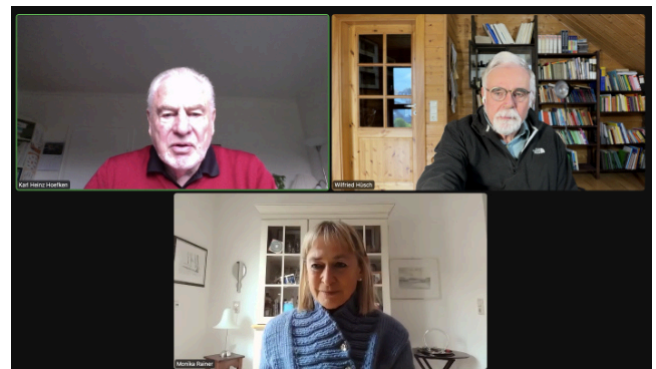
Interview über ZOOM am 20.11.2023