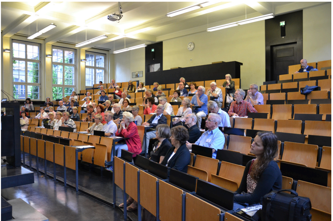
Studienkontakttage 2016

Höfken: Nein, das nicht! Angehörige der Universität zu sein, heißt aber auch, man kann nicht einfach sagen, wir schaffen das Seniorstudium ab. Wir sind seit 2015 Teil der Grundordnung der Universität. Das gibt uns eine gewisse Sicherheit. Man kann uns nicht einfach vor die Tür setzen. Wir haben ja auch über DENISS (Deutsches Netzwerk der Interessenvertretungen von Seniorstudierenden, d. Red. ) mehrfach versucht, auch bei anderen Universitäten diesen Gedanken zu verankern. Ich glaube, das ist bisher noch nirgendwo gelungen. Wir haben auch das Recht, uns eine eigene