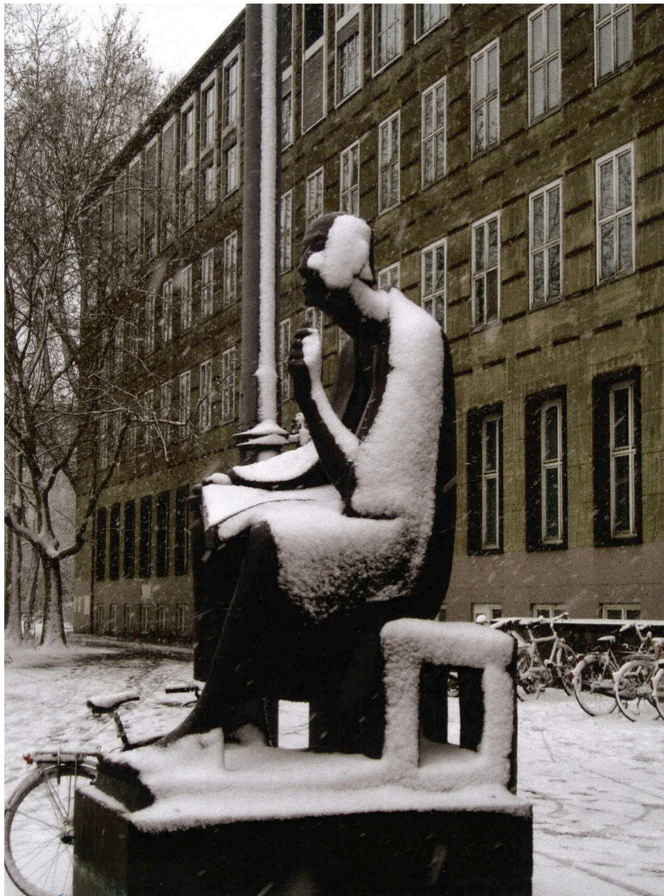
„Der Schnee von gestern“

Universität zu Köln • Koordinierungsstelle Wissenschaft + Öffentlichkeit